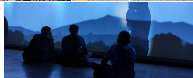
Επίσκεψη στο Μουσείο Μαστίχας