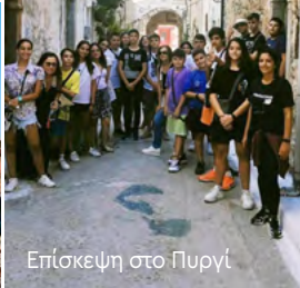
Επίσκεψη στο Πυργί