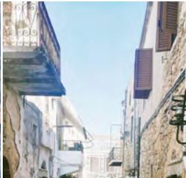
Ρεμβασμός στο Κάστρο της Χίου